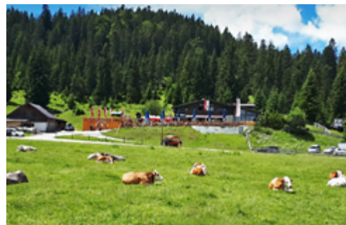
Die urgemütliche Wildmoosalm