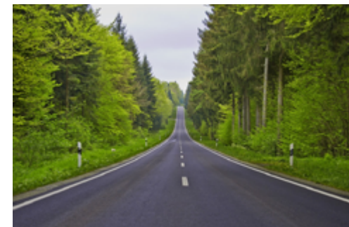
Strassen die mitten durch Wälder führen

Das Mindestalter für die Teilnahme an HSOP-Pokerturnieren bedingt das erreichte 18. Altersjahr.