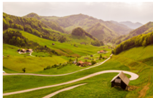
Auf Serpentine im Hinterland