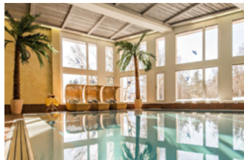
Der lichtdurchflutete Pool