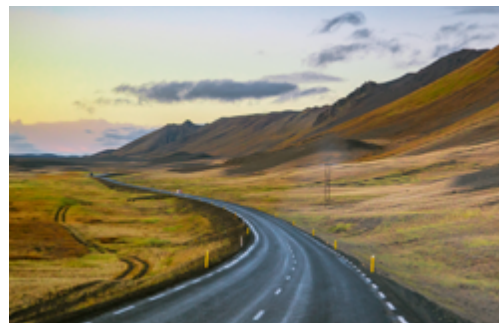
Strassen mit Weitsicht