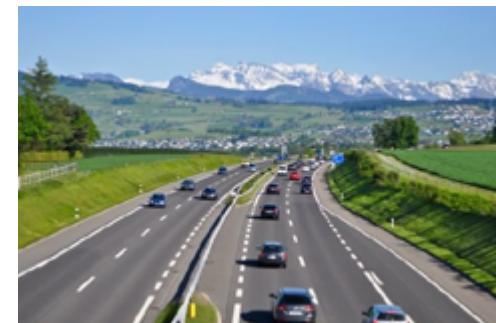
Autobahn mit Bergsicht

Die Ein- und Ausreisebestimmungen der beteiligten Länder bitten wir strikt einzuhalten. Bei Missbrauch, insbesondere bei meldepflichtigen Geldmengen, lehnt HSOP die Verantwortung und Haftung ab.