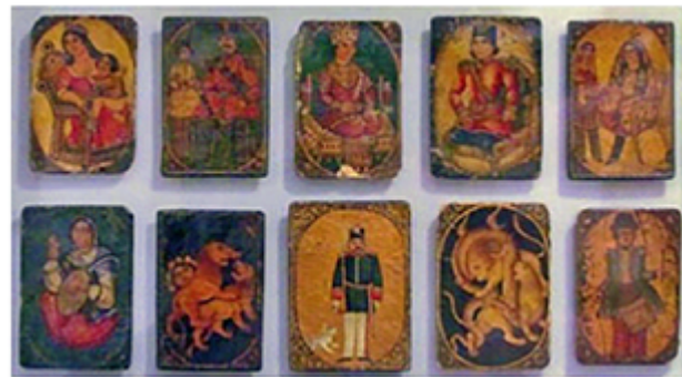
„as nas“ Spielkarten

Der Ursprung des beliebten Kartenspiels liegt mehrere Jahrhunderte in der Vergangenheit. Es gibt verschiedene Theorien, die sich allerdings nicht eindeutig belegen lassen.