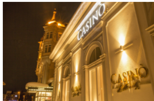
Die abendliche Casinofront in St. Moritz

Ausserdem verfügen alle frequentierten Casinos neben einer ganz eigenen und speziellen Ambiance auch über ein ausgezeichnetes Gastronomie- und Getränkeangebot.