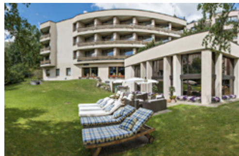
Das Hotel Quadratscha**** in Samedan

Zwei der drei Destinationen 2019 liegen in landschaftlich aussergewöhnlich reizvollen Bergregionen und die dritte Destination überzeugt mit echtem „Las Vegas-Feeling“ – speziell auch Pokerfreunde.