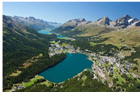
St. Moritz mit See von oben

Die Touren sind als leicht einzustufen und führen durch interessante und landschaftlich reizvolle Regionen. Die unterwegs besuchten Raststätten laden zu Speis und Trank – vielfach mit einer tollen Aussicht.