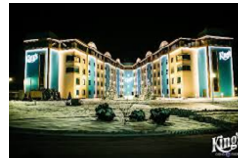
Das Kings-Hotel**** in Rozvadov

Spezielle Angebote zum körperlichen Wohlbefinden, wie zum Beispiel verschiedene Massagen, Therapien und weitere Annehmlichkeiten, können kostenpflichtig direkt vor Ort gebucht werden.