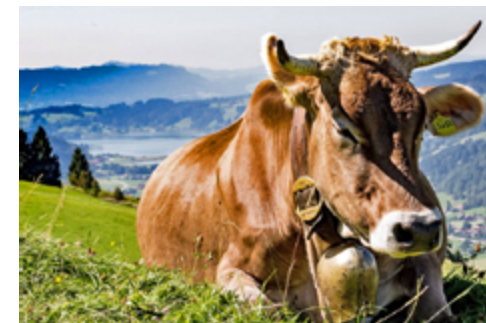
Wo dir wohl ist, da lasse dich nieder