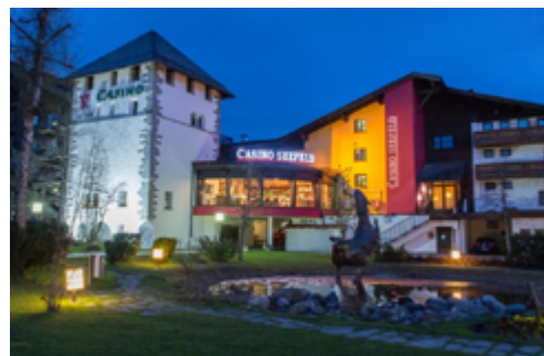
Das Casino von Seefeld im Tirol