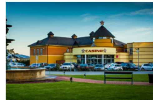
Das Casino von Rozvadov

Für die Teilnahme an HSOP Pokerturnieren ist das erreichte 18. Atersjahr eine zwingende Voraussetzung. Nach der Durchführung des Pokerturniers besteht deshalb die Möglichkeit, sich weiter im Casino zu vergnügen.