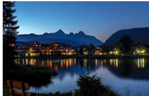
Der Wildsee bei Seefeld im Tirol