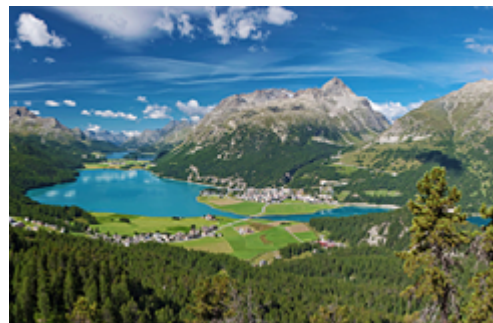
Das wunderschöne Engadin