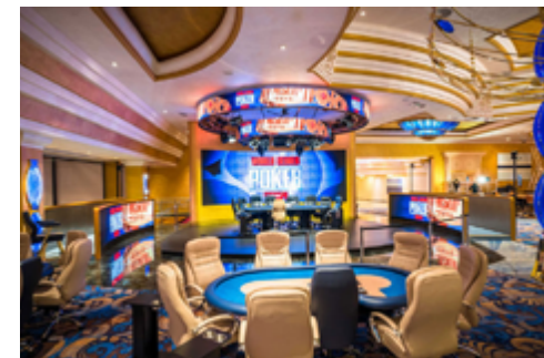
Der Pokersaal im King's Casino