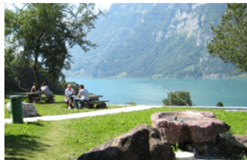
Pausen an den schönsten Plätzen

Die Fahrt wird im modernen Reisebus durchgeführt. Ausgestattet mit guter Laune, Audio, Video und Getränken wird jede Fahrt so kurzweilig und angenehm wie möglich gestaltet.