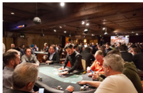
Ein Pokertisch im Casino Seefeld