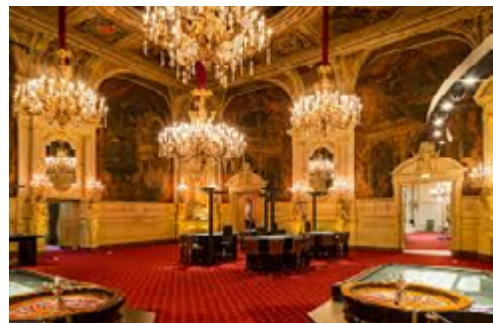
Ein Spielsaal im Casino St. Moritz