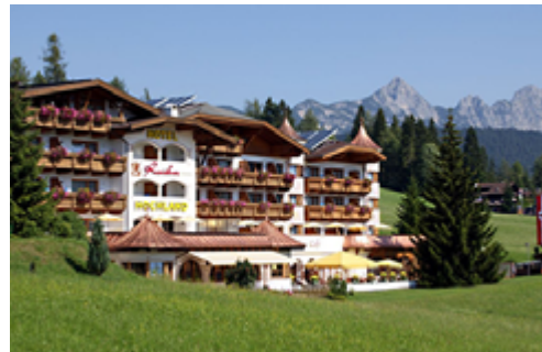
Die Residenz Hochland**** im Tirol