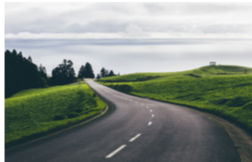
Aufwärts kommt man dem Himmel nah